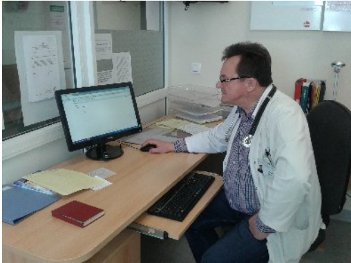
Tauragės ligoninės Priėmimo- skubiosios Pagalbos skyriuje

Sukurta ir įdiegta regioninė informacinė sistema bus integruota su eSPBI IS, vadovaujantis Sveikatos priežiūros įstaigų informacinių sistemų susiejimo su e. sveikatos paslaugų ir bendradarbiavimo infrastruktūra reikalavimais ir techninėmis sąlygomis, patvirtintomis Lietuvos Respublikos sveikatos apsaugos ministro 2010 m. gruodžio 17 d. įsakymu Nr. V-1079 (Žin., 2010, Nr. 152-7759).