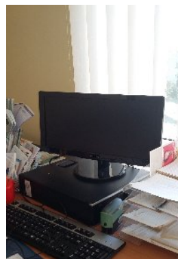
Pagėgių Pirminės sveikatos priežiūros centre